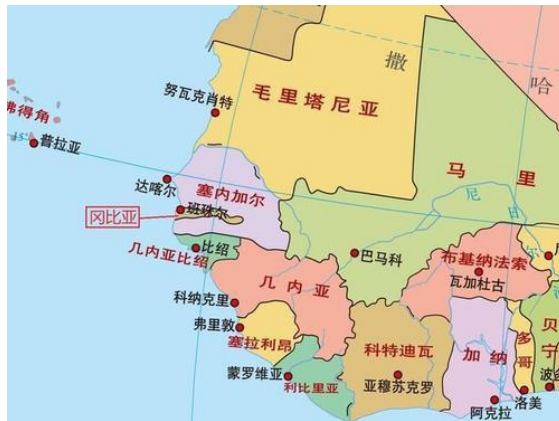
图 1 冈比亚地图

冈比亚位于非洲西部，国土面积 11300 平方公里，其中陆地面积 10120 平方公里，海域面积 1180 平方公里，是非洲大陆最小的国家。地形为狭长平原，几乎全部被塞内加尔共和国包围，两国边境线长 749 公里。沿大西洋的西海岸线长 80 公里，是其唯一的出海口。冈比亚自然资源贫乏。已探明的矿产资源有铀、锆、金红石混生矿（储量约 150 万吨）和高岭土（50 多万吨），正在进行石油勘探。渔业资源较丰富。