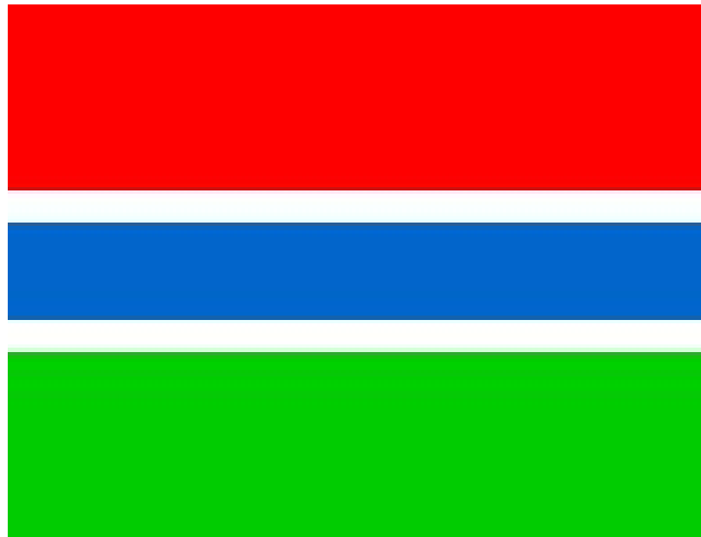
图 2 冈比亚国旗

冈比亚为总统制共和制国家。议会为一院制，称国民议会，每届任期 5 年，设有议长、副议长各 1 名，均由议员选举产生。